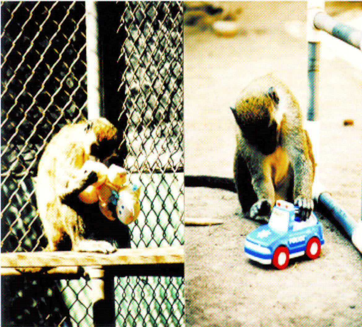
Female monkeys spent more time with 'female' toys and male monkeys spent more time with 'male' toys.